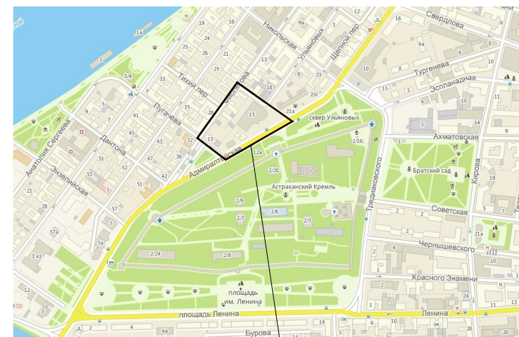
Местоположение земельного участка