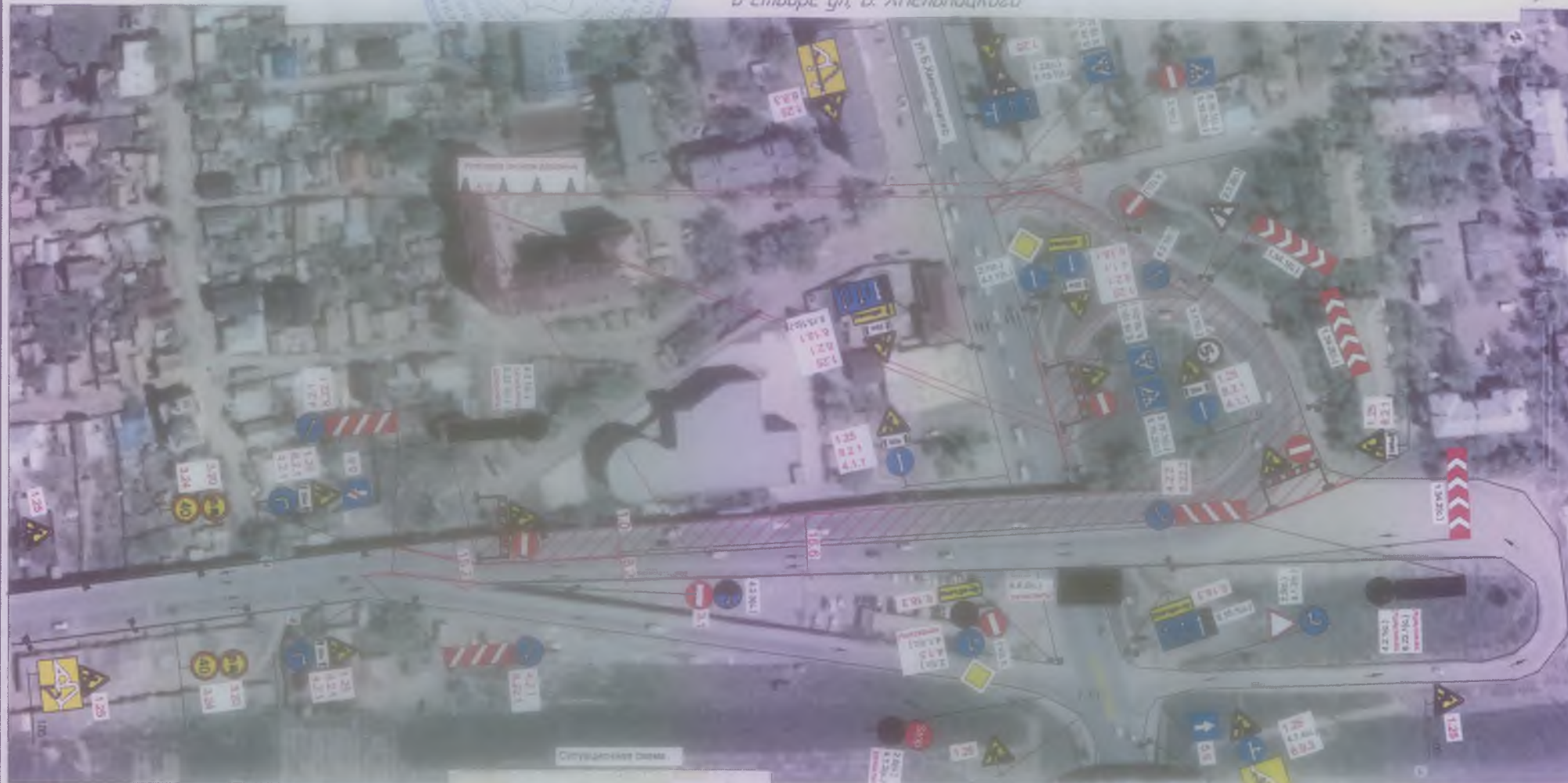
Схема организации дорожного движения №2 на время проведения работ по капитальному ремонту подъема на совмещенный железнодорожный мост через р. Волга в створе ул. Б. Хмельницкого

Утверждена Распоряжением администрации муниципального образования Город Астрахань от 17.06.2014 г. 392-р