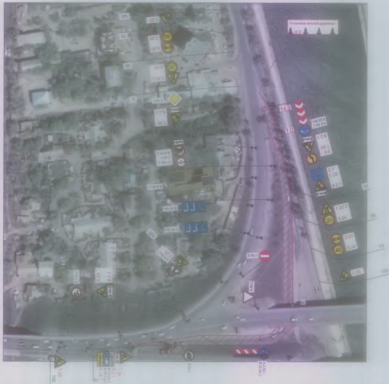
Схема организации дорожного движения №4 на время проведения работ по капитальному ремонту подъема на совмещенный железнодорожный мост через р. Волга в створе ул. Б. Хмельницкого

Утверждена Распоряжением администрации муниципального образования «Город Астрахань» от 01.04.2016 № 164-Р