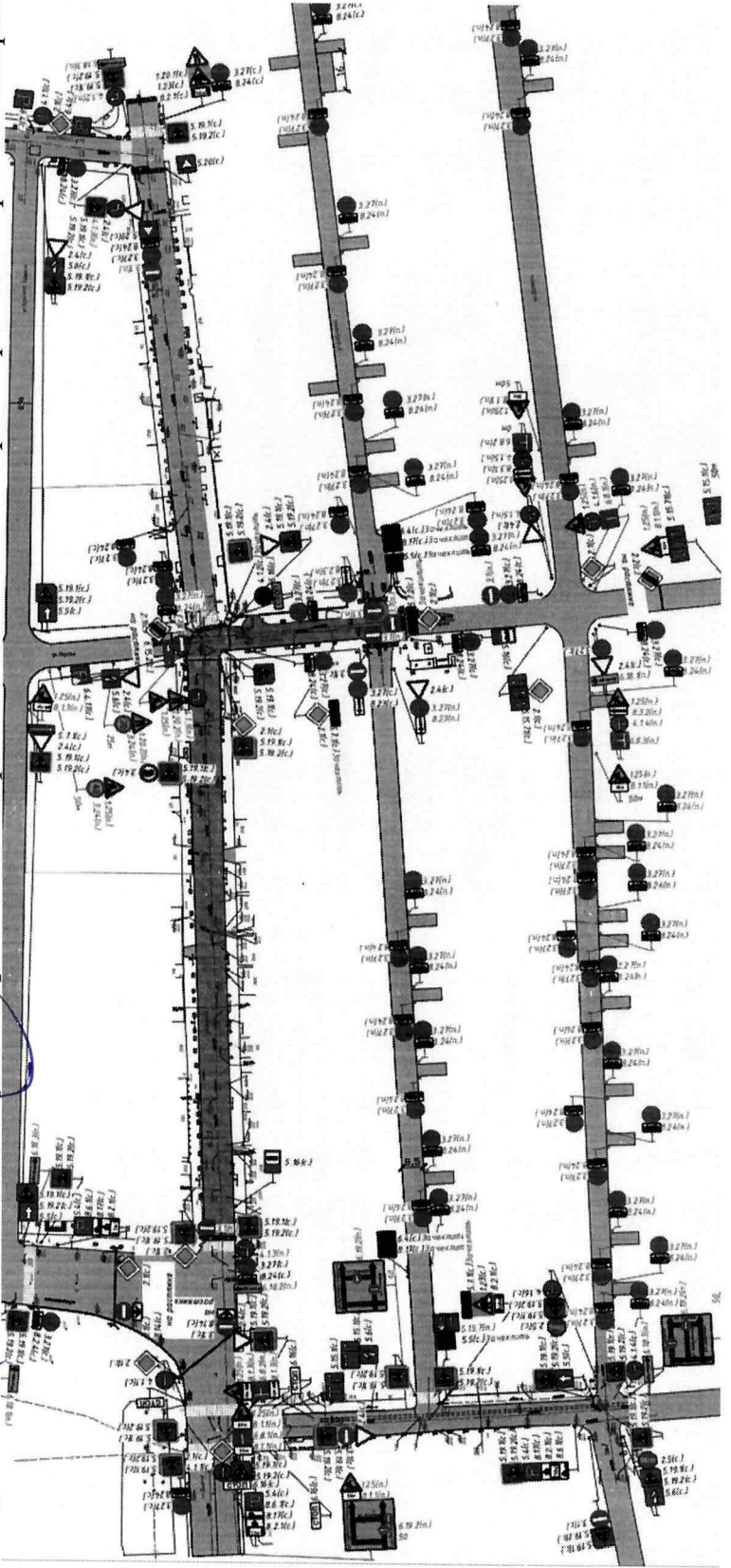
Схема расположения технических средств организации дорожного движения на время проведения ремонтных работ.

Утверждена распоряжением администрации муниципального образования «Городской округ город Астрахань» от 09.01.2025 № 01-р