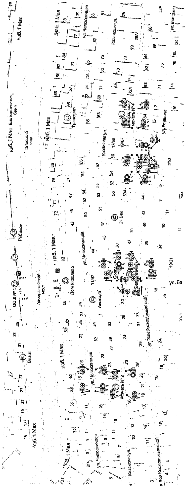
Схема расположения технических средств организации дорожного движения на время проведения празднования «Ураза – байрам»

Утверждена распоряжением администрации муниципального образования «Городской округ город Астрахань» от 28.03.2015 № 396-р