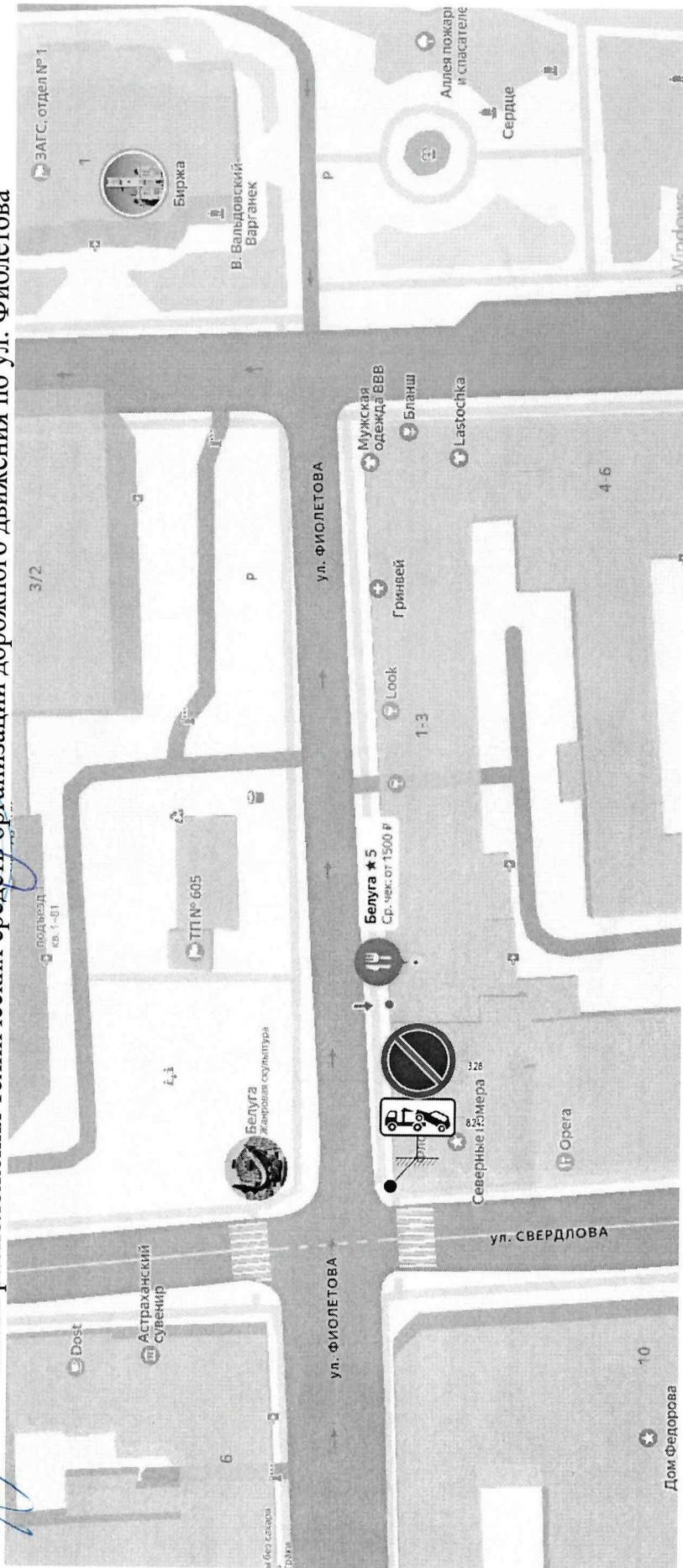
Схема расположения технических средств организации дорожного движения по ул. Фиолетова

Утверждена постановлением администрации муниципального образования «Городской округ город Астрахань» от 05.06.2026 № 534