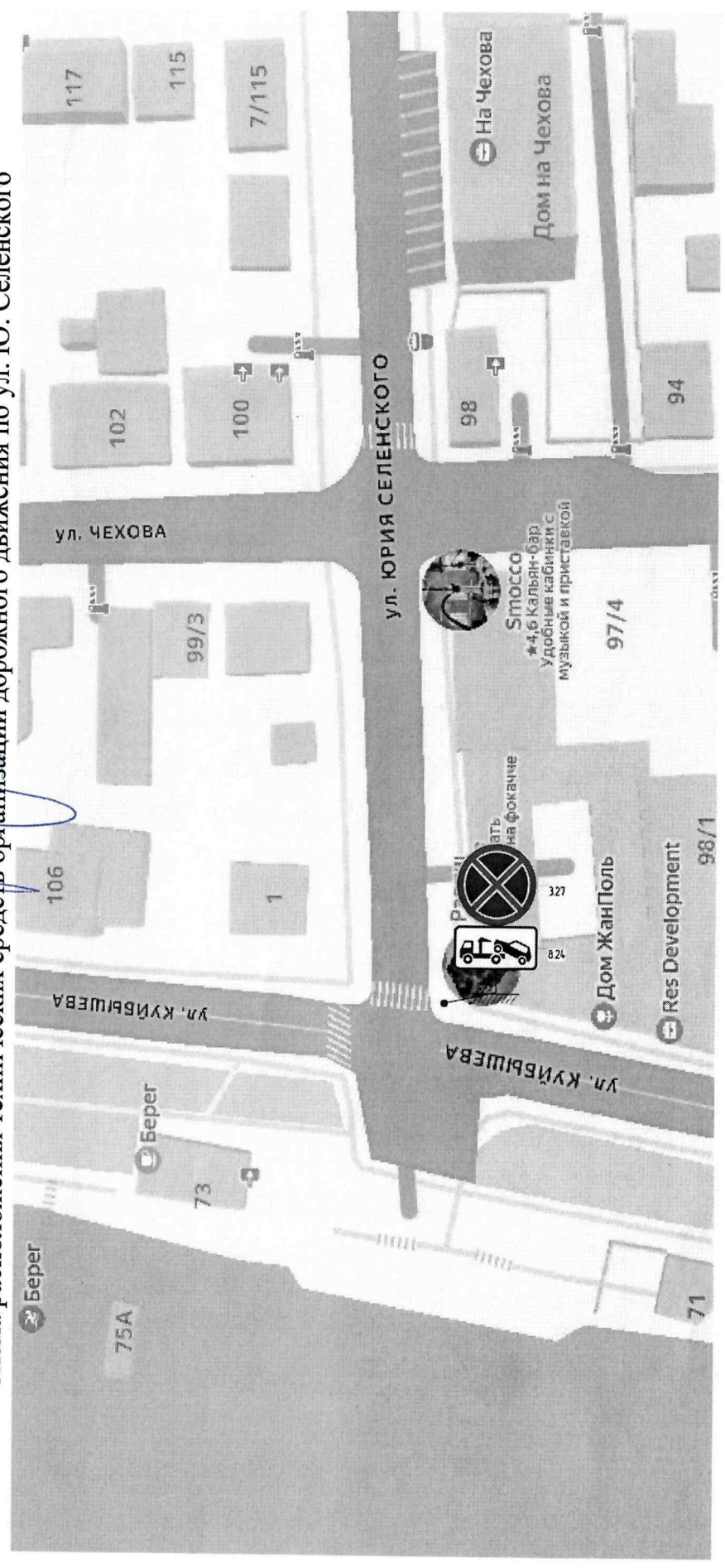
Схема расположения технических средств организации дорожного движения по ул. Ю. Селенского

Утверждена постановлением администрации муниципального образования «Городской округ Город Астрахань» от 05.06.2016 № 534