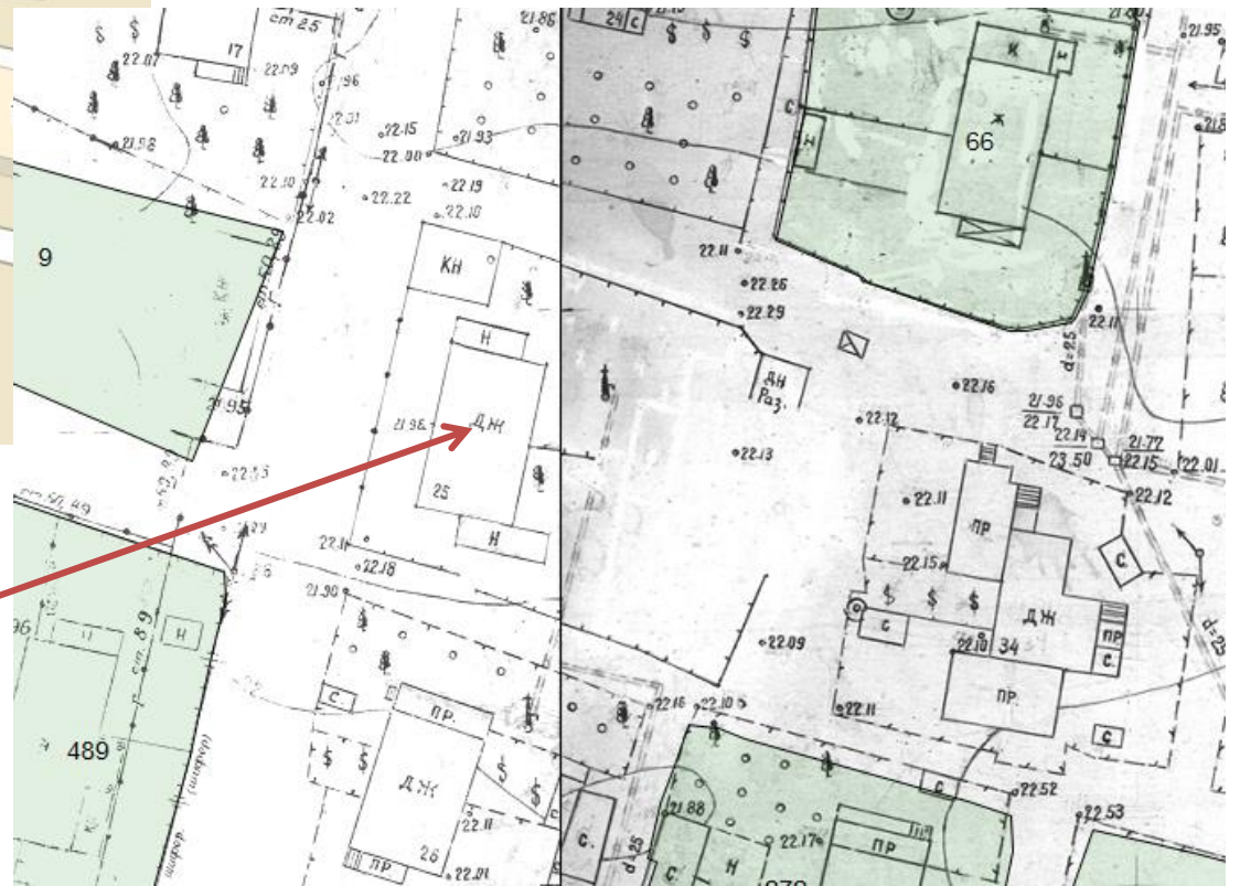
Многоквартирный дом по пл. Славянской, 25 в Ленинском районе